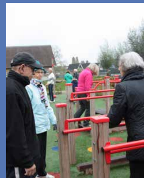
Uitleg en begeleiding bij fysio apparatuur tbv spierversterking

Op maandag- en donderdagochtend om 10.30 uur kan bij goed weer getraind worden op het veld naast de kinderboerderij. Bij slecht weer en winterkou staat de deur open van de sportzaal in Brede School De Wilgenbroek. De groep op maandag is inmiddels erg groot. Op donderdag zijn belangstellenden welkom om aan te sluiten. De leeftijd van de deelnemende dames en heren varieert van zestig tot ruim negentig. Er zijn geen kosten aan verbonden.