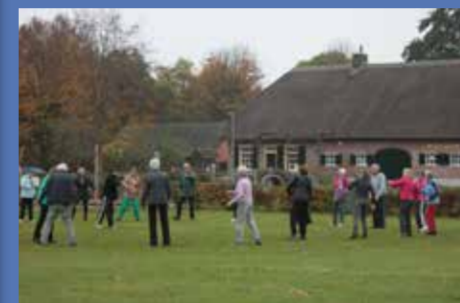
-Vrije bewegingsuitvoering op het veld-